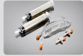
60ml/60ml MRG Şırınga Parça No:200103

Uygulama Kapsamı: Medrad Incorporated ABD: Spectris&Solaris MRG Yüksek Basınç Enjektörü Standart Konfigürasyonu: 1-65ml şırınga, 1-115ml şırınga 1-Y (T) tip bağlantı hortumu, 2-pipet