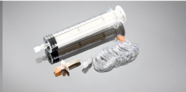
100 ml BT Şırınga Parça No: 100109

Uygulama Kapsamı: Nemoto Kyorindo Co., Ltd., Japonya A-60 CT Yüksek Basınç Enjektörü Standart Konfigürasyonu: 1-200ml şırınga, 1-1500mm bağlantı hortumu, 1-pipet