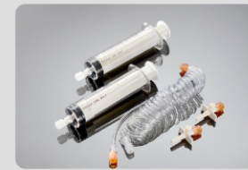
60ml/60ml MRG Şırınga Parça No:200104

Uygulama Kapsamı: Liebel-flarsheim ABD: Optistar LE, Elite MRG Yüksek Basınç Enjektörü Standart Konfigürasyonu: 2-60ml şırınga, 1- Y (T) tip bağlantı hortumu, 2-pipet