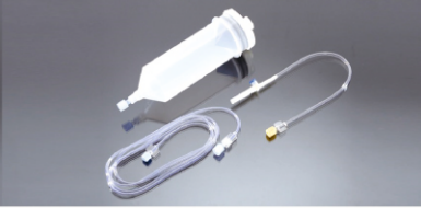
200 ml BT Şırınga Parça No: 100105

Uygulama Kapsamı: CT9000 & CT9000 ADV CT Series Yüksek Basınç Enjektörü Liebel-Flarsheim Company, ABD Tek Şırınga Enjektörü Konfigürasyonu: 1-200ml şırınga 1-1500mm bağlantı hortumu, 1-Pipet Çift Şırınga Enjektörü Konfigürasyonu: 2-200ml şırınga, 1-Y (T) tip bağlantı hortumu, 2-Pipet