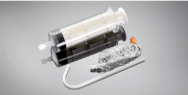
200 ml BT Şırınga Parça No: 100108

Uygulama Kapsamı: ShenZhen Seacrown Medical Instrument Co., Ltd, Çin 1-Zenith-C10 CT Yüksek Basınç Enjektörü 2-Zenith-C11 CT Yüksek Basınç Enjektörü Standart Konfigürasyonu: 1-100ml şırınga, 1-1500mm bağlantı hortumu, 1-pipet