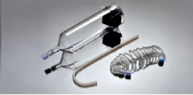
200 ml BT Şırınga Parça No: 100106

Uygulama Kapsamı: ASA-200 CT Yüksek Basınç Enjektörü Shenzhen Anke High-Tech Co., Ltd., Çin Standart Konfigürasyonu: 1-200ml şırınga, 1-1500mm bağlantı hortumu, 1-Pipet 1-1500mm bağlantı hortumu, 1-Pipet