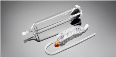
200 ml BT Şırınga Parça No: 100111

Uygulama Kapsamı: Nemoto Kyorindo Co., Ltd., Japonya A-25&A-60 CT Yüksek Basınç Enjektörü Standart Konfigürasyonu: 1-100ml şırınga, 1-1500mm bağlantı hortumu, 1-pipet