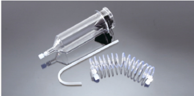
200 ml BT Şırınga Parça No: 100101

Uygulama Kapsamı: Medrad Incorporated, ABD 1 MCT & MCT Plus BT Yüksek Basınç Enjektörü 2 Vision CT Yüksek Basınç Enjektörü 3 En Vision Yüksek Basınç Enjektörü Standart Konfigürasyonu: 1-200ml şırınga, 1-1500mm bağlantı hortumu, 1-Pipet