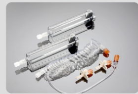
65ml/65ml MRG Şırınga Parça No:200105

Uygulama Kapsamı: Nemoto Kyorindo Co., Ltd., Çin Sonic shot 50 MRG Yüksek Basınç Enjektörü Standart Konfigürasyonu: 2-60ml şırınga, 1 Y (T) tip bağlantı hortumu, 2-pipet