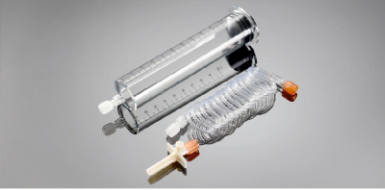
100 ml BT Şırınga Parça No: 100107

Uygulama Kapsamı: Zenith-20CT Yüksek Basınç Enjektörü Shenzhen Seacrown Medical Instrument Co., Ltd, Çin Standart Konfigürasyonu: 1-200ml şırınga, 1-1500mm bağlantı hortumu, 1-pipet