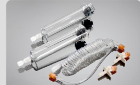
65ml/65ml MRG Şırınga Parça No:200101

Uygulama Kapsamı: ShenZhen Seacrown Medical Ins. Co., Ltd, Çin Zenith - C60 MRG Yüksek Basınç Enjektörü Standart Konfigürasyonu: 2-65ml şırınga, 1 Y (T) tip bağlantı hortumu, 2-pipet