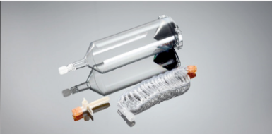
200 ml BT Şırınga Parça No: 100112

Uygulama Kapsamı: EZEM Inc. ABD 1 Empower Tek CT Yüksek Basınç Enjektörü 2 Empower Çift CT Yüksek Basınç Enjektörü Tek Şırınga Enjektörü Konfigürasyonu: 1-200ml şırınga, 1-1500mm bağlantı hortumu, 1-pipet Çift Şırınga Enjektörü Konfigürasyonu: 2-200ml şırınga, 1-Y (T) tip bağlantı hortumu, 2-Pipet