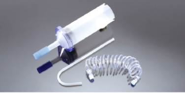
200 ml BT Şırınga Parça no: 100104

Uygulama Kapsamı: Medrad Incorporated, ABD 1 SinoPower-S Tek Şırınga BT Yüksek Basınç Enjektörü 2 SinoPower-D Çift Şırınga BT Yüksek Basınç Enjektörü Tek Şırınga Enjektörü Konfigürasyonu: 1-200ml şırınga, 1-1500mm bağlantı hortumu, 1-Pipet Çift Şırınga Enjektörü Konfigürasyonu: 2-200ml şırınga, 1-Y (T) tip bağlantı hortumu, 2-Pipet