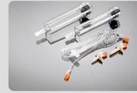
65ml/115ml MRG Şırınga Parça No:200102

Uygulama Kapsamı: ShenZhen Seacrown Medical Ins. Co., Ltd, Çin Zenith - C60 MRG Yüksek Basınç Enjektörü Standart Konfigürasyonu: 2-65ml şırınga, 1 Y (T) tip bağlantı hortumu, 2-pipet