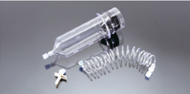
200 ml BT Şırınga Parça No: 100103

Uygulama Kapsamı: Sino Medical Device Technology Co., Ltd., Shenzhen, Çin 1 SinoPower-S Tek Şırınga BT Yüksek Basınç Enjektörü 2 SinoPower-D Çift Şırınga BT Yüksek Basınç Enjektörü Tek Şırınga Enjektörü Konfigürasyonu: 1-200ml şırınga, 1-1500mm bağlantı hortumu, 1-Pipet Çift Şırınga Enjektörü Konfigürasyonu: 2-200ml şırınga, 1-Y (T) tip bağlantı hortumu, 2-Pipet